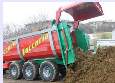
Scarico a Spinta con paratia + tappeto