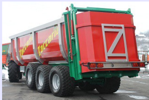
Versione Dumper con portellone idraulico