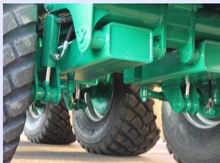
Sospensioni idrauliche indipendenti