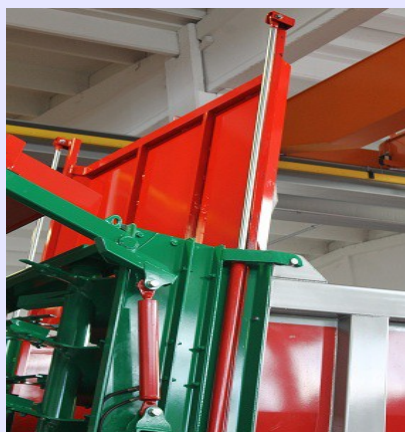
Paratoia idraulica a tenuta stagna

Con l'applicazione rapida dell'apparecchiatura di spargimento a due rulli giganti al posto del portellone idraulico il DoublePush si trasforma in un Spandiletame di altissime prestazioni.